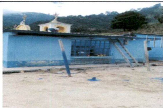
Foto 2: Sustitución de lámina, por lámina troquelada aluzinc calibre 26